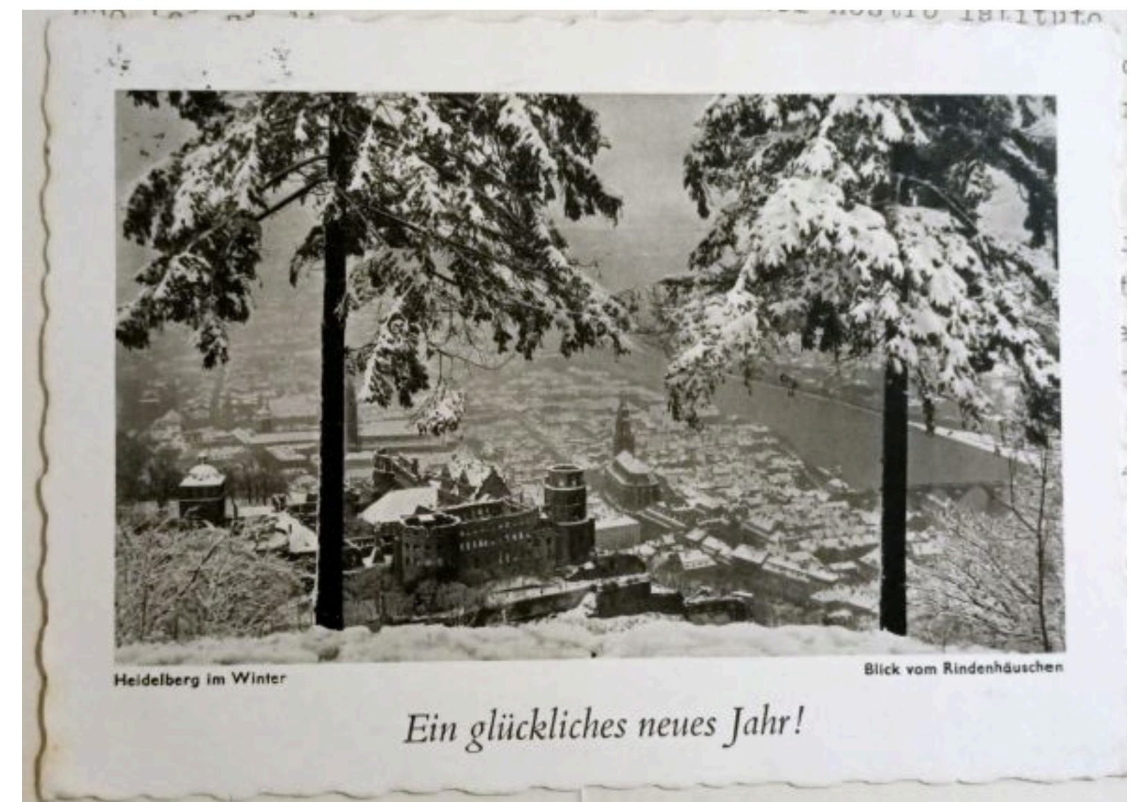
Fig. 2 - XXXXXXXXXX