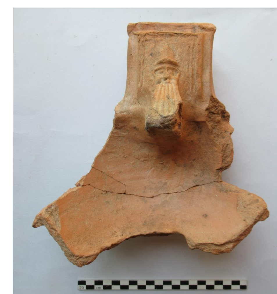
Fig. 2 - Sostegno e parte della vasca di un braciere da Velia.