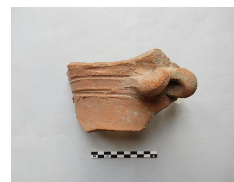
Fig. 3 - Parte del fusto con ansa di un braciere da Velia.